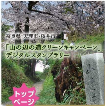
奈良県：天理市・桜井市 「山の辺の道クリーンキャンペーン」 デジタルスタンプラリー